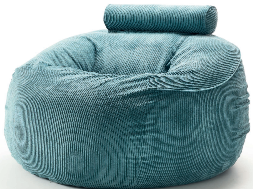
Pouf Astra 140 + poggiatesta