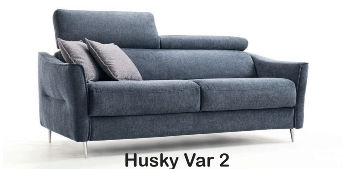
Husky Var 2