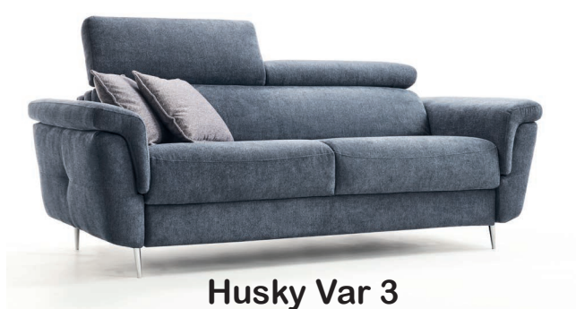
Husky Var 3