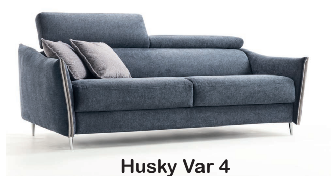
Husky Var 4